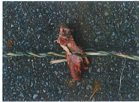
写真③ ミフミズナ（魔除け縄）

⑧豚の腸、血、鼻、耳（左右）、尻尾、足先（2つ）、骨の小片も、これは生のまま揃える。腸は、藁3本を撚った縄でしばり、これを7つ束ねたものと37束ねたものを準備する。これら各部位でもって、豚一頭分に見立てる。まとめてバナバナ（pana-bana 豚の尖った部分の供物）と呼ぶ。