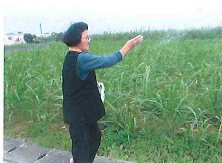
写真⑨ 供物をばらまく

その後、ユーザスとカントックは公民館に戻って、豚肉を煮て食し、その日の労をねぎらったようである。