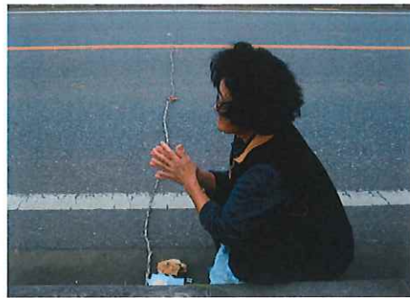
写真④ 路上でのユーザスの祈願

(4) カントックは、魔除け用に約3m長さの左縄を14本作る。この左縄をミフミズナ（mifumi-dzina）と呼ぶ。中央部分に豚の胸骨か腰骨を1個挟んで吊す。この縄を路上に横たえると、悪霊が恐れをなして、この境界線から先へは進んでこないという。この縄を集落の出入り口に置くことによって、集落内への悪霊の浸入を防ごうという考えのようである。