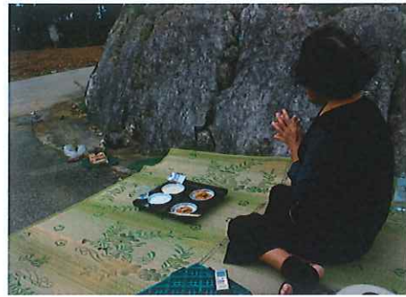
写真⑧ ユーザスの祈願

カムヌ ニガイチョーンカイ kam-nu nigaitjo:-nkai そのことを 神さまの「祈願帳」に